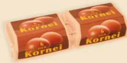
Superface® на 6 яиц – E7412