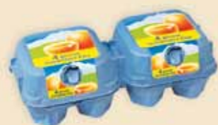
Mini Poster Pack™ на 4 яйца – E6608

Упаковка Plus Pack™ с прямой печатью или Mini Poster Pack™ с высококачественной этикеткой 7 различных размеров подходит для всех единиц расфасовки. Многочисленные варианты оформления придают особую привлекательность ассортиментам из нижнего и среднего сегмента рынка.