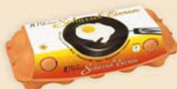
imagic® на 10 яиц – E9910