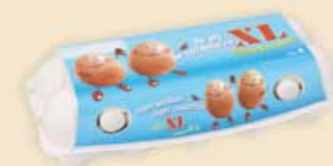
imagic® MAX на 10 яиц – E9410