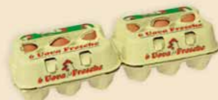
Fresh Pack™ на 6 яиц – E4912

Выразительность продукта находит свое выражение в упаковке – с печатью, нанесенной яркими красками. Эта упаковка с «окошками» 2 различных размеров чаще всего ассоциируется со свежестью и предназначена для нижнего ценового сегмента.