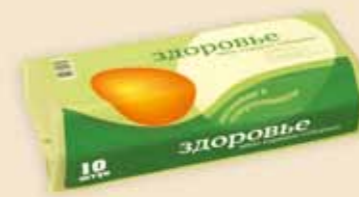
Superface® на 10 яиц – E7210