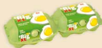
imagic® MAX на 6 яиц – E9312