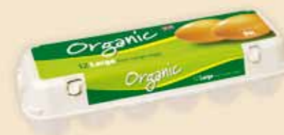
Mini Poster Pack™ на 12 яиц – E5412