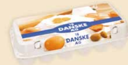
Mini Poster Pack™ на 18 яиц – E3918