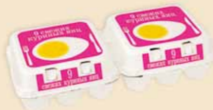
Plus Pack™ на 9 яиц – E7918