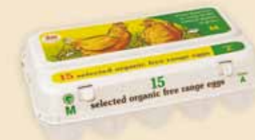
Plus Pack™ на 15 яиц – E5915