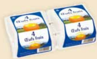
Superface® на 4 яйца – E7108

Мы поставляем первоклассное качество 4 размеров в 8 цветовых исполнениях с высококачественной этикеткой. Продукт класса «премиум» с большой информационной площадью годится в равной степени как для сильных торговых марок, так и для фирменных яиц. Эффективность рекламы на полках магазинов розничной торговли не проходит незамеченной.