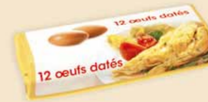
Superface® на 12 яиц – E7312