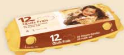
imagic® на 12 яиц – E9212