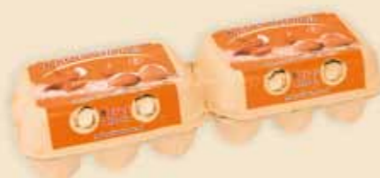
Mini Poster Pack™ на 6 яиц – E5312