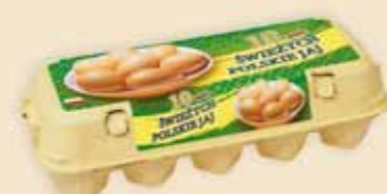
Mini Poster Pack™ на 10 яиц – E3310