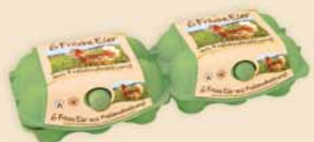
imagic® на 6 яиц – E9812

Для яиц размером XL мы поставляем яркую упаковку imagic® MAX 2 размеров. Профессиональные этикетки обеспечивают большее внимание к продукту на рынке.