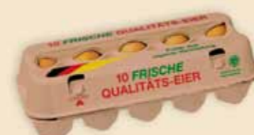
Fresh Pack™ на 10 яиц – E3810